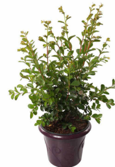
Lilas des Indes