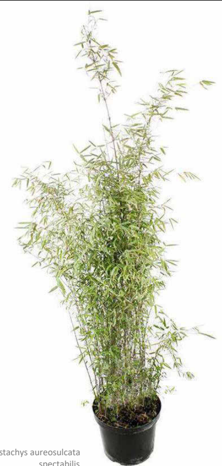
phyllostachys aureosulcata spectabilis