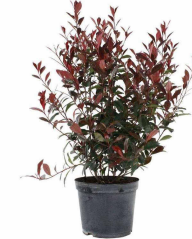
photinia carre rouge