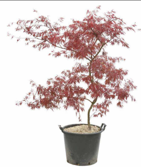
Acer palmatum dissectum 'Tamukeyama'

Pot en terre cuite : dimension : Ø 300 mm (20 pots) dimension : Ø 400 mm (15 pots) dimension : Ø 500 mm (10 pots)