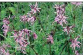
ceillet des près