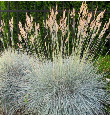
Festuca glauca 'Intense Blue'