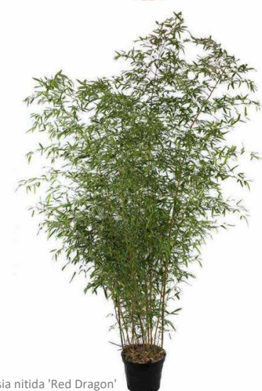
fargesia nitida 'Red Dragon'