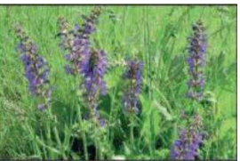
sauge des près