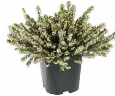
Erica X darleyensis 'White perfection'