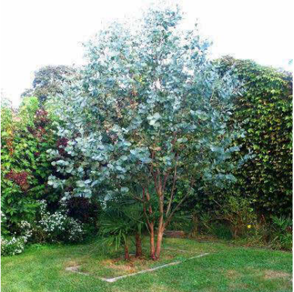
Eucalyptus pulverulenta 'Baby Blue'